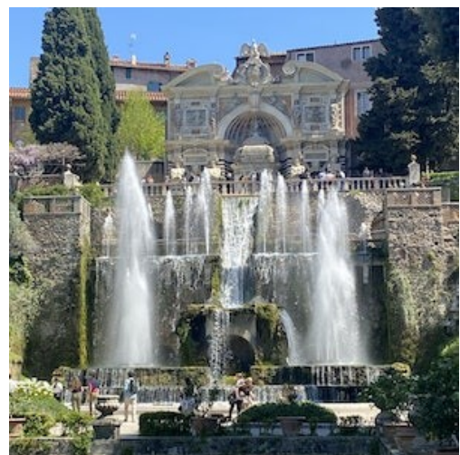
Zahrady ve Villa d'Este