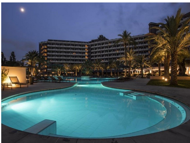
Hotel Ergife Palace

Ergife Palace Hotel **** se nachází na klidném místě ve čtvrti Via Aurelia a nabízí svým hostům řadu vymožeností. Mezi hlavní přednosti hotelu patří jeden z největších venkovních bazénů ve městě, který hostům nabízí vítanou příležitost k relaxaci a osvěžení. Další výhodou je blízkost památek, jako je Vatikán a Piazza Navona. Hotel má příjemnou vstupní halu a elegantní hotelový bar, kde můžete zakončit večer sklenkou. Restaurace "Le Quattro Stagioni" nabízí tradiční římskou a italskou kuchyni a umožňuje hostům vychutnat si lahodnou místní gastronomii. Zahrada s terasami zve k pobytu venku a nabízí příjemné místo k odpočinku. Pro hosty, kteří chtějí zůstat během pobytu aktivní, je k dispozici také fitness centrum. Pokoje v Ergife Palace Hotel jsou klimatizované a mají vlastní koupelnu. K vybavení patří také satelitní TV, telefon a balkon pro zpříjemnění pobytu hostů. Kromě toho je k dispozici bezplatné Wi-Fi, aby hosté mohli zůstat neustále ve spojení se světem. Celkově Ergife Palace Hotel **** nabízí hostům pohodlný pobyt s nejrůznějším vybavením a jeho dobrá poloha jim umožňuje individuálně poznávat město Řím.